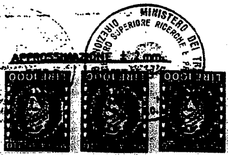
FAC SIMILE TARGHETTA DI IDENTIFICAZIONE

IL DIRETTORE DEL CENTRO SUPERIORE DI PROVE AUTOMOTRICI (Dott. ...)