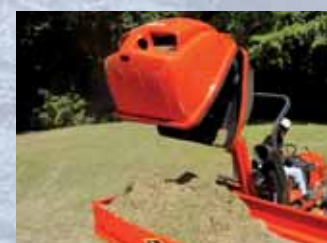
CESTO DI RACCOLTA