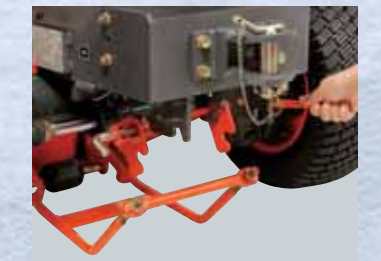
SISTEMA DI AGGANCIAMENTO SGANCIO RAPIDO