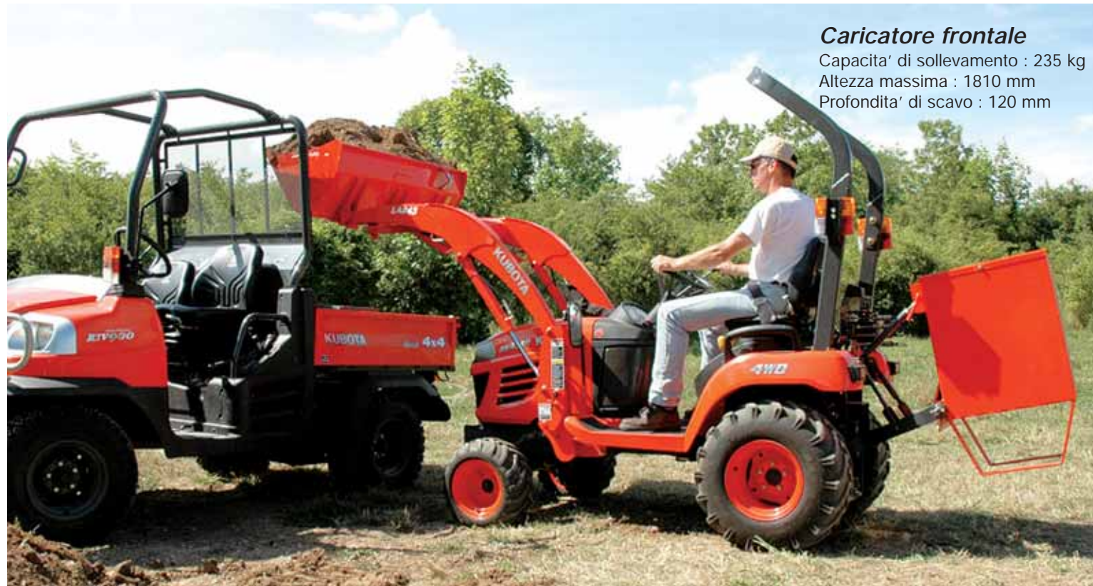
Caricatore frontale Capacita' di sollevamento : 235 kg Altezza massima : 1810 mm Profondita' di scavo : 120 mm