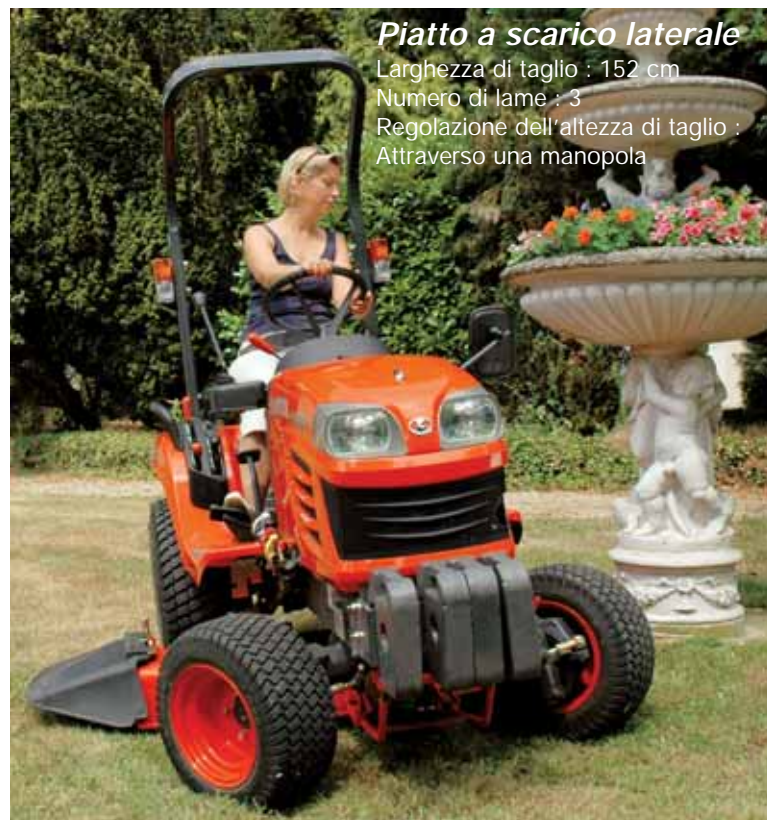
Piatto a scarico laterale Larghezza di taglio : 152 cm Numero di lame : 3 Regolazione dell'altezza di taglio : Attraverso una manopola