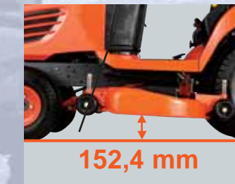
ELEVATA LUCE LIBERA