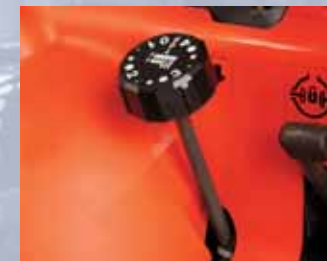
MANOPOLA DI REGOLAZIONE ALTEZZA DI TAGLIO