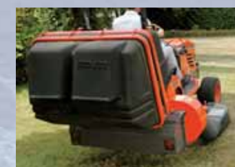
CESTO DI RACCOLTA