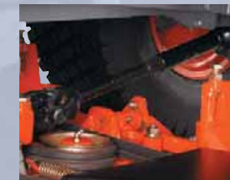
TRASMISSIONE A CARDANO