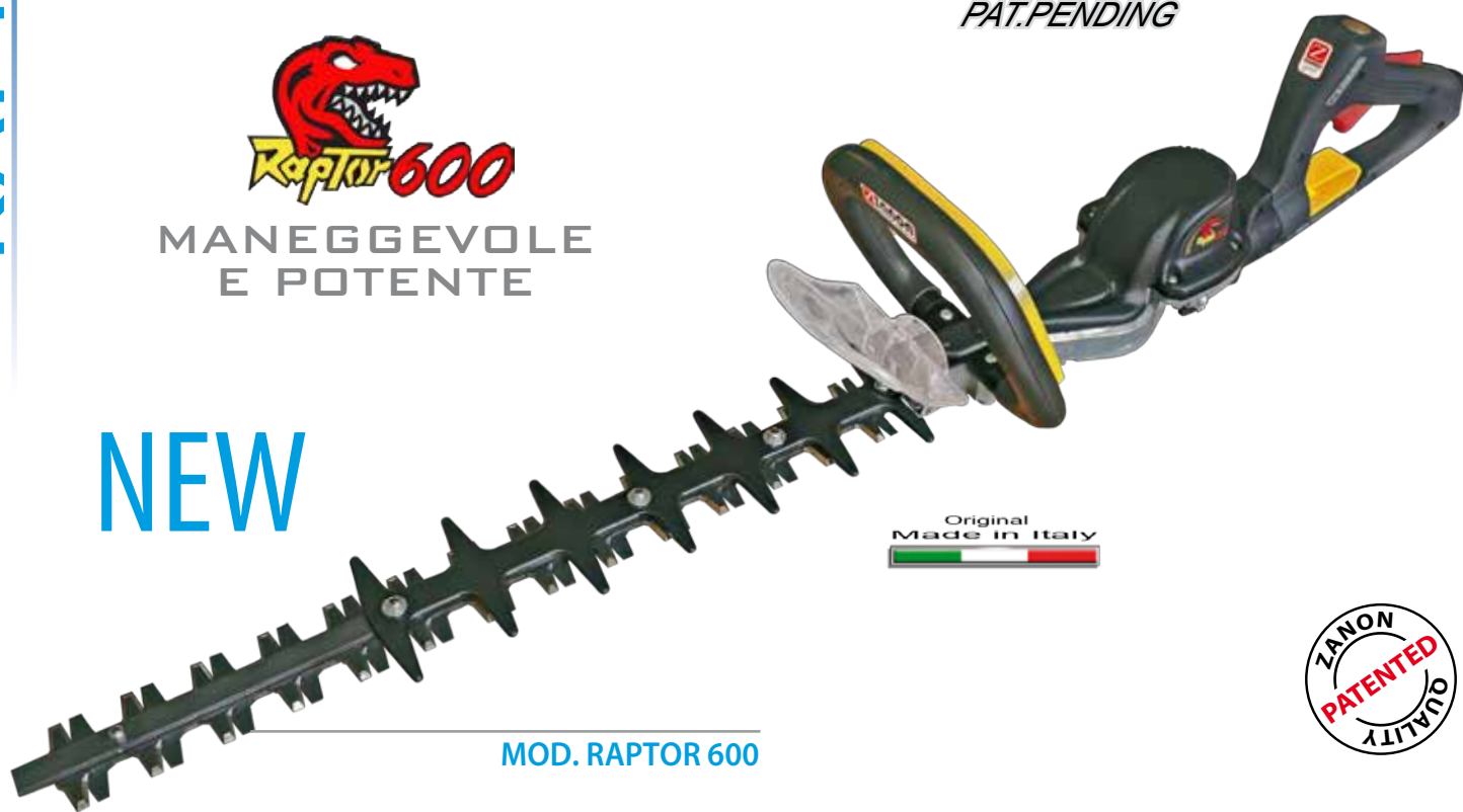
MOD. RAPTOR 600