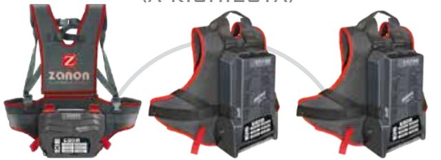
DRIVE 600.S LITHIUM BATTERY